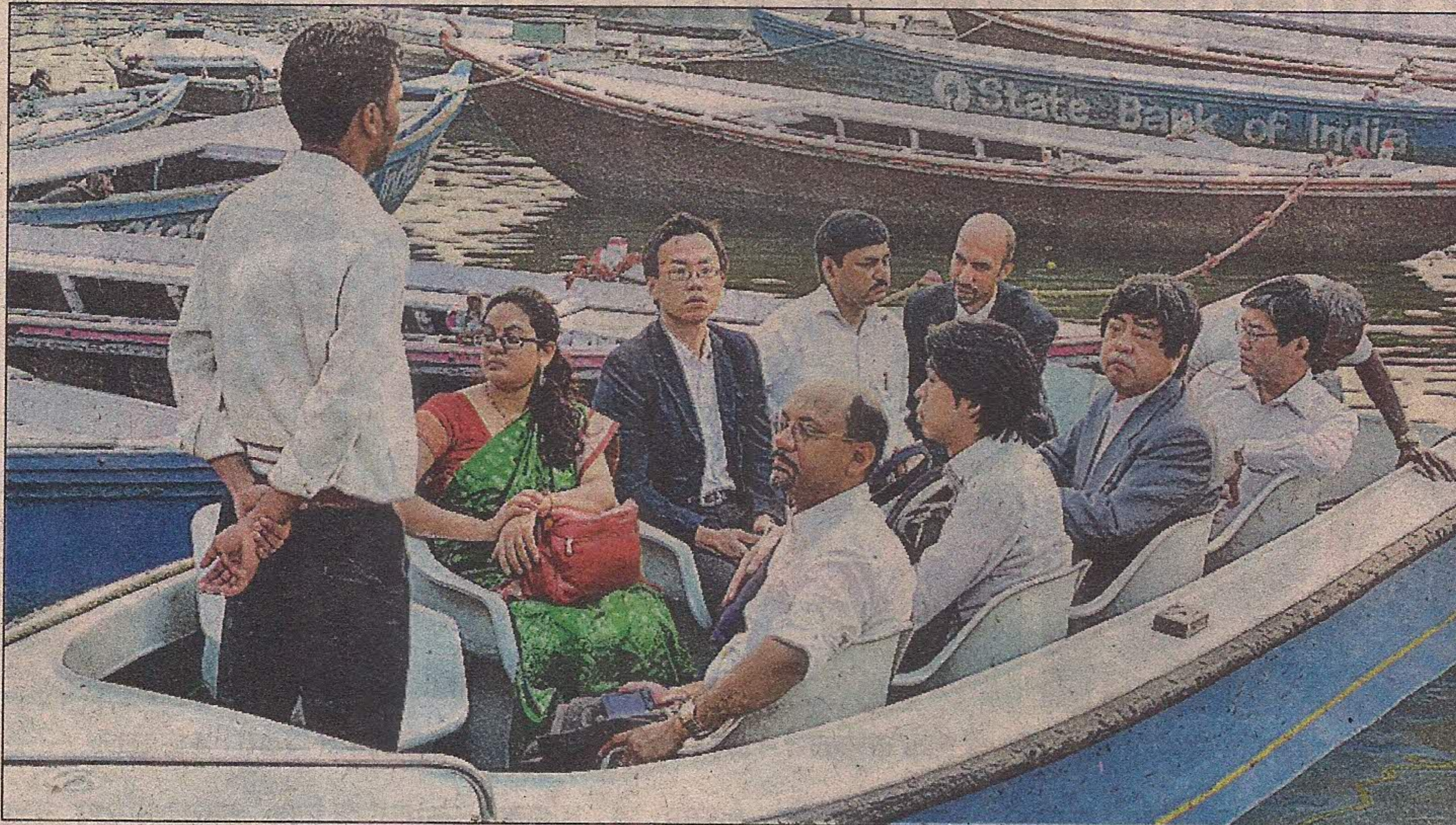
क्योटो से आए दल ने शुक्रवार को गंगा में बोटिंग की और घाट का नजारा देखा।